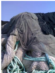
PA6 Oppdrettsnot HDPE Trawl