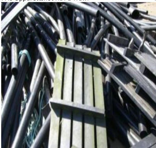
HDPE Fôrslanger og gangbaner